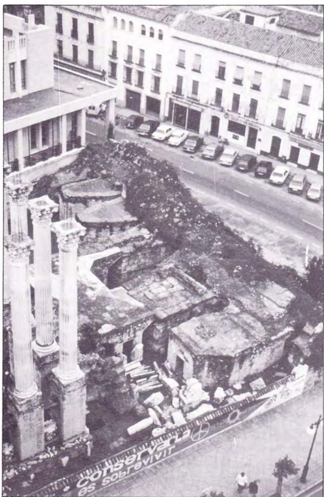
LÁMINA II. Templo romano de la calle Claudio Marcelo en Córdoba. Zona delantera con la plataforma del altar y el sistema de contrafuertes (anterides).